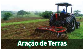
Aração de Terras