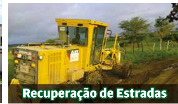
Recuperação de Estradas