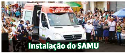
Instalação do SAMU