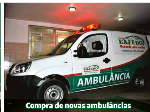
Compra de novas ambulâncias