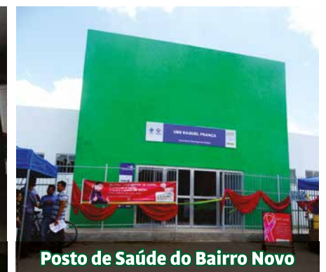
Posto de Saúde do Bairro Novo