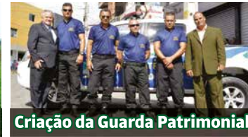
Criação da Guarda Patrimonial