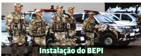
Instalação do BEPI