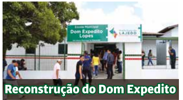
Reconstrução do Dom Expedito