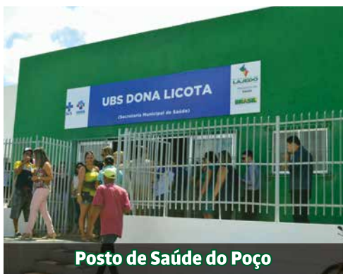
Posto de Saúde do Poço