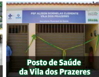
Posto de Saúde da Vila dos Prazeres