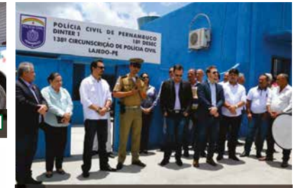
Apoio às Polícias Civil e Militar