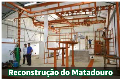
Reconstrução do Matadouro