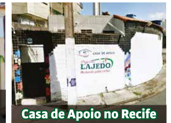
Casa de Apoio no Recife