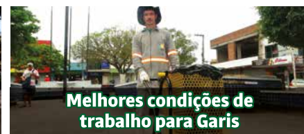
Melhores condições de trabalho para Garis