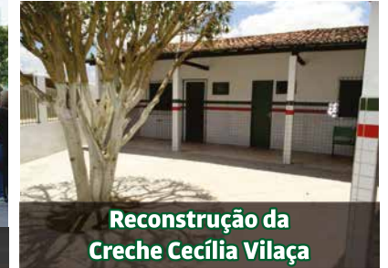
Reconstrução da Creche Cecília Vilaça