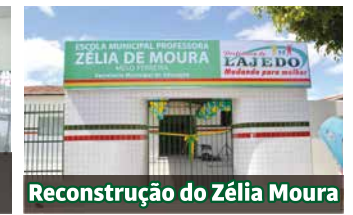
Reconstrução do Zélia Moura