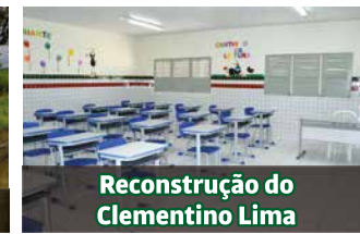
Reconstrução do Clementino Lima