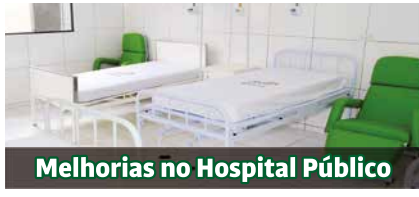
Melhorias no Hospital Público