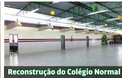
Reconstrução do Colégio Normal