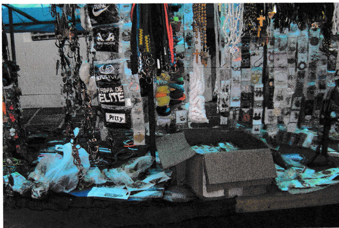
FOTO 2: Banco com bijuterias. 17/09/2008