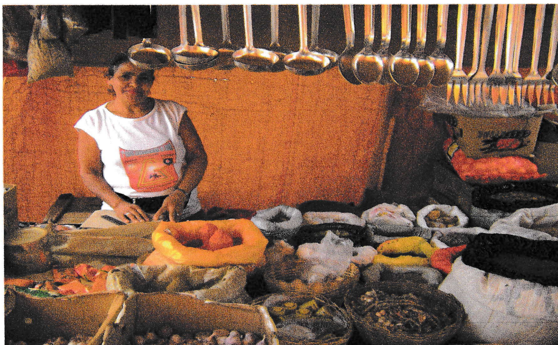
FOTO 1 – Feirante vendendo ervas. 17/09/2008