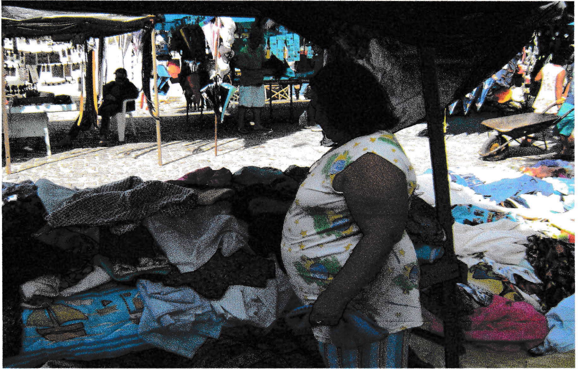
FOTO 3 – Feirante vendendo retalhos de tecidos. 17/09/2008