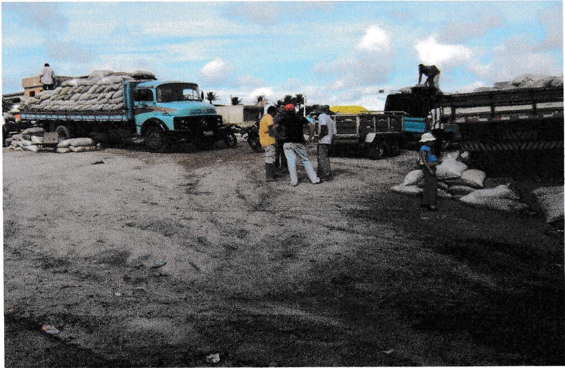
FOTO 9: Feira do esterco. 17/09/2008