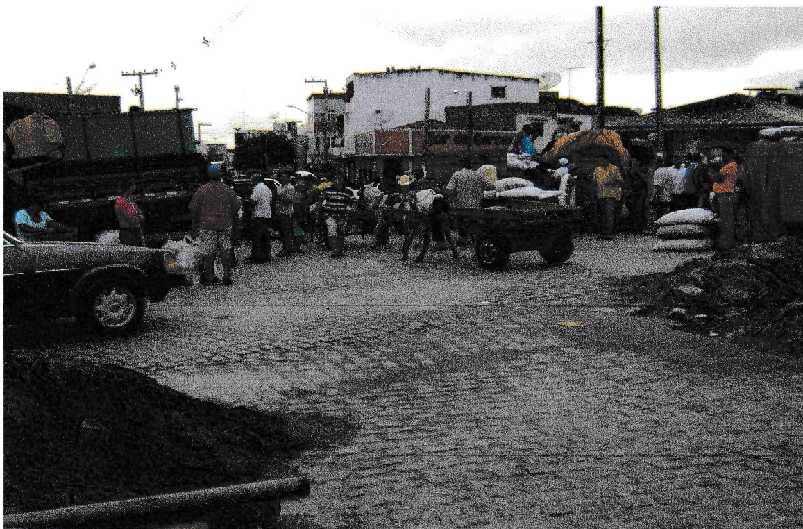
FOTO 12: Feira do feijão. 17/09/2008