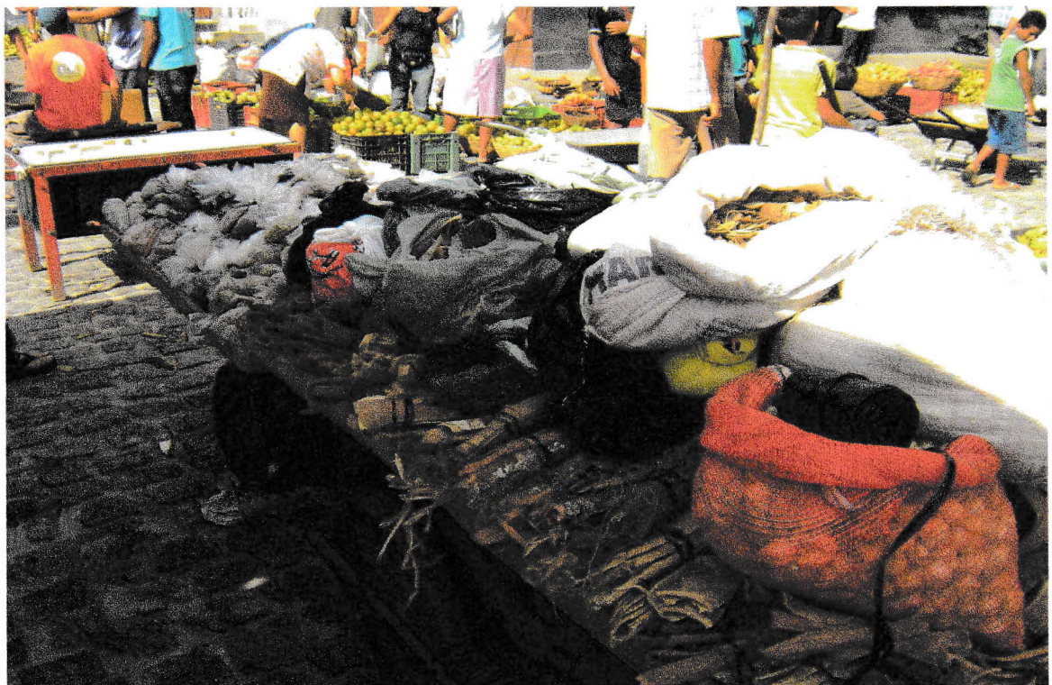
FOTO 6 : Carroça com ervas.17/09/2008