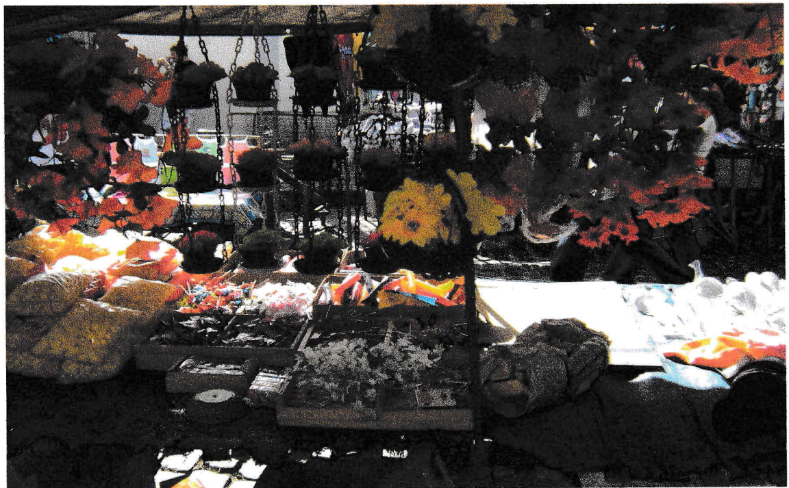
FOTO 4: Banco com flores e guloseimas. 17/09/2008