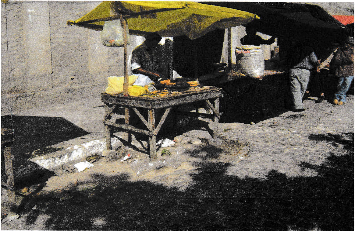
FOTO 7 : Feirante vendendo tabaco. 17/09/2008