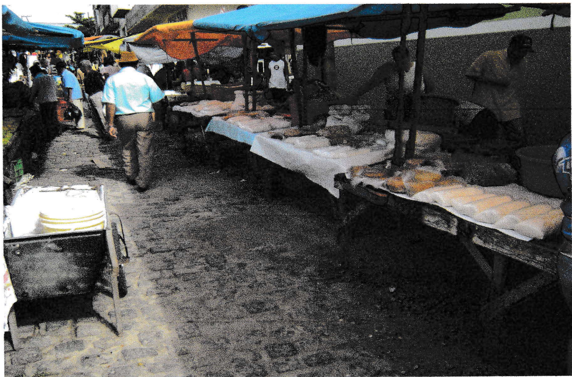
FOTO 8: Feirantes vendendo massa de mandioca. 17/09/2008