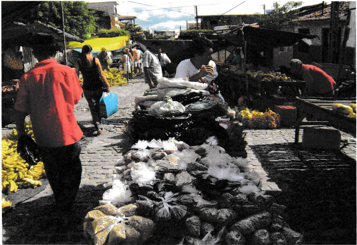
FOTO 5 : Ambulante vendendo ervas.17/09/2008