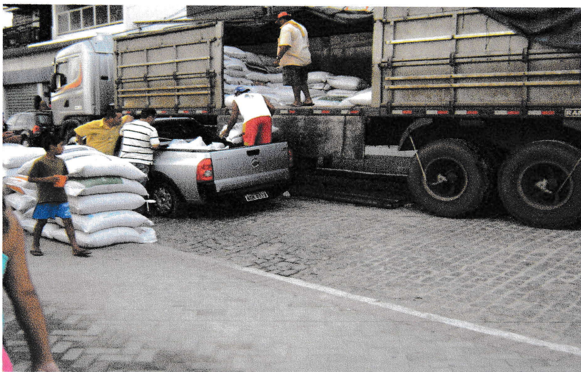
FOTO 11: Homens descarregando carreta com sacos de feijão. 17/09/2008