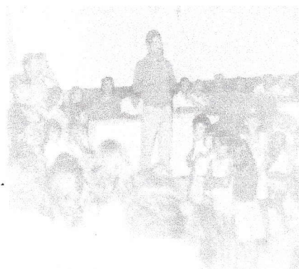
Homenagem e palestra para crianças carentes do CSU (Centro Social Urbano) 1981.

Todo o seu dinamismo e vontade de divulgar a cultura popular lhe renderam inúmeras homenagens nas escolas e convites para palestrar para o público infantil, juvenil e adulto das redes tanto particulares quanto públicas municipais e estaduais.