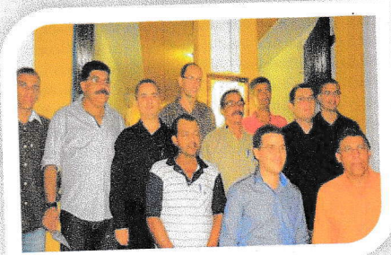
I Semana da Memória Lajedense – 2014 Membros Fundadores