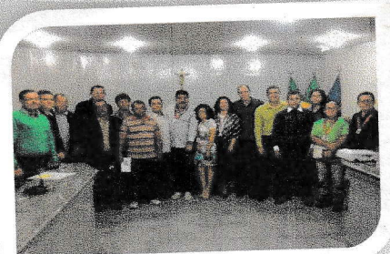
II Semana da Memória Lajedense - 2015