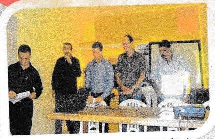
I Semana da Memória Lajedense – 2014 / Palestras