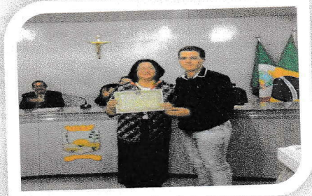
II Semana da Memória Lajedense – 2015 Entrega das comendas