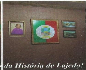
Um Pequeno Espaço Guardiã da História de Lajedo!